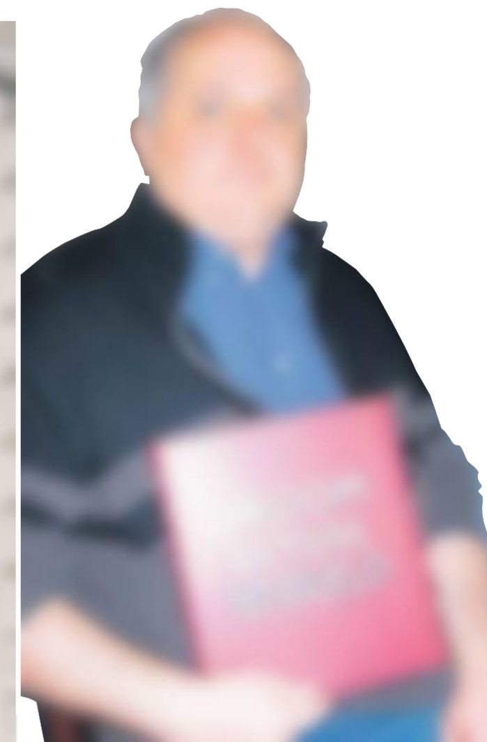
Hamse historicus toont trots zijn 'Droom van een betere wereld'.